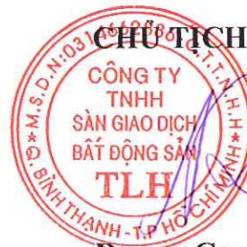
Dương Cao Tường